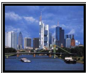
Ausstattung von Seminaren, Konferenzen & Kongressen weltweit