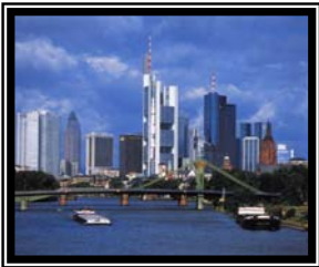
Ausstattung von Seminaren, Konferenzen & Kongressen weltweit