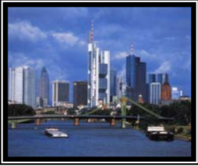
Ausstattung von Seminaren, Konferenzen & Kongressen weltweit